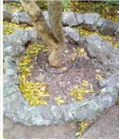
This is the pomegranate, to which I used to climb when I was a "monkey".