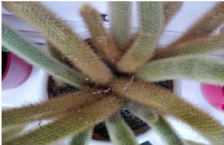
This is the first cactus, which I bought and it reminds me my childhood.