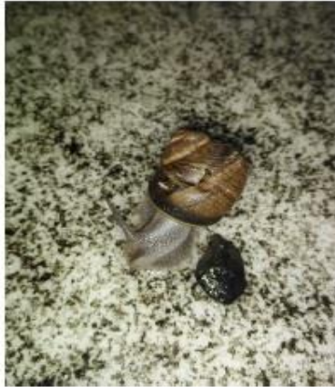
Above us there are two elements of the Nature, which witness the coming of the Winter.