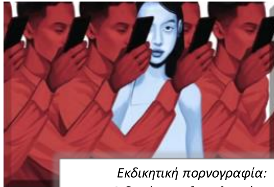
Εκδικητική πορνογραφία: «Ο δημόσιος εξευτελισμός»

Η μη συναινετική δημοσιοποίηση ιδιωτικού ερωτικής φύσεως υλικού θεωρείται υποκατηγορία ενός ευρύτερου φαινομένου, της άσκησης βίας μέσω διαδικτύου. Το φαινόμενο περιλαμβάνει από τις πιο ήπιες μορφές σεξουαλικής παρενόχλησης, όπως ο σεξουαλικός εκβιασμός, μέχρι απειλές ζωής, διαρροή προσωπικών δεδομένων, έως και ψηφιακά υποστηριζόμενη εμπορία ανθρώπων. Το φαινόμενο αυτό όπως έχει διαπιστωθεί στην επιστημονική έρευνα, προκαλεί ανεπανόρθωτη ηθική και ψυχοσωματική βλάβη στα θύματα.