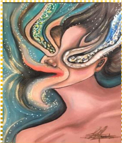
«Γυναικείος θρυμματισμός: Ο αντίκτυπος της εκδικητικής πορνογραφίας» Ζωγραφική: Αθανασία Πετσέτα

παρουσιάζεται κυρίως ο αντίκτυπος αυτού του συγκλονιστικού βιώματος που καθιστά τη γυναίκα ανίκανη να εκφραστεί, να ζητήσει βοήθεια, να γίνει αποδεκτή σε μία κοινωνία που την κατακρίνει. Σε μια κοινωνία που την καθιστά αδύναμη να καταγγείλει το συμβάν ώστε να ασκηθεί δίωξη, λόγω της μη επαρκούς νομοθεσίας. Αποτέλεσμα να μετατρέπεται σε όργανο εκμετάλλευσης που δεν έχει δικαίωμα να αντιδράσει, και να στιγματίζεται, εφόσον δεν μπορεί να θεωρήσει τον εαυτό της ψυχικά «αρτιμελή» για να επιστρέψει «αλώβητη» στην καθημερινότητα.