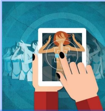
Εκδικητική πορνογραφία: «Η δημόσια σεξουαλική κακοποίηση»

Η εργασία που παρουσιάζεται είναι συνέχεια της συμμετοχής στην επιτροπή για την εκδικητική πορνογραφία του Ευρωπαϊκού Κοινοβουλίου των Νέων, στην Περιφερειακή Συνδιάσκεψη της Λάρισας. Αξιοποιώντας τα επιστημονικά δεδομένα της συμμετοχής, έγινε μια προσπάθεια αποτύπωσης του φαινομένου, σε έναν συνδυασμό επιστημονικών απόψεων και τέχνης.