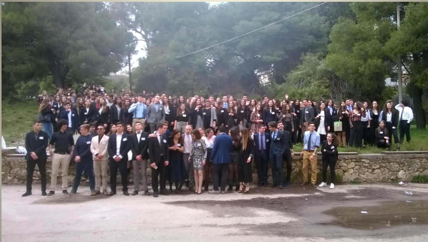
1 ο Μαθητικό Συνέδριο Προσομοίωσης Ηνωμένων Εθνών Πρότυπο Γενικό Λύκειο Αναβρύτων Άλσος Συγγρού, Μαρούσι, 24-25/02/2018 Αναμνηστική Φωτογραφία